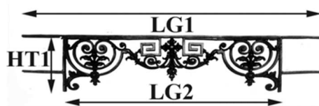
Schéma explicatif dimensionnel