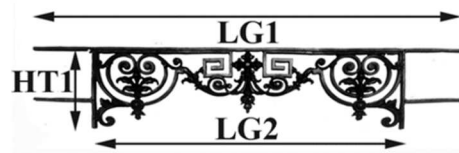
Schéma explicatif dimensionnel