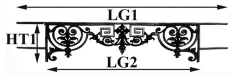
Schéma explicatif dimensionnel