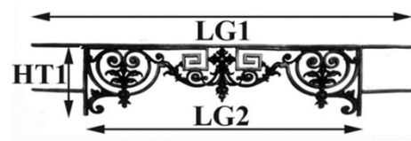
Schéma explicatif dimensionnel