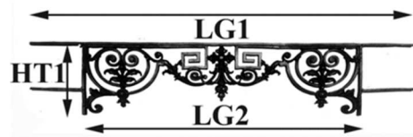
Schéma explicatif dimensionnel